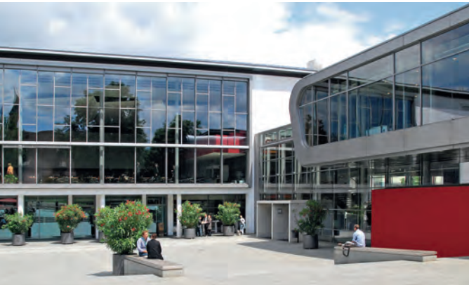
Stand: 29. März 2021

VERANSTALTUNGSORT (FÜR DIE LIVE-STREAMING-AUSSTRAHLUNG) K3N-Halle Heiligkreuzstraße 4 72622 Nürtingen Fon: +49 (0) 7022 – 2434-0 Fax: +49 (0) 7022 – 2434-20 www.K3N-Halle.de